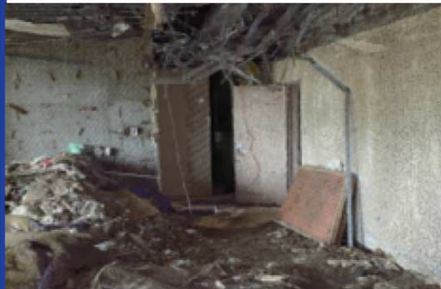
▲ 陸前高田市中央公民館の内部の様子