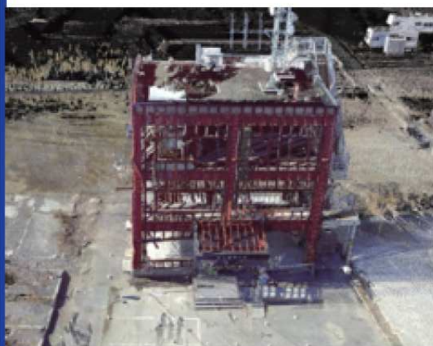
▲ 上空から見た南三陸町防災対策庁舎