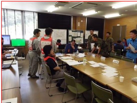
九州北部豪雨における朝倉市の災害対策本部