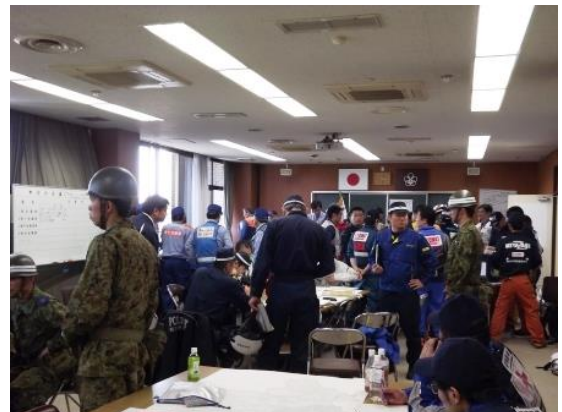
熊本地震における益城町の災害対策本部