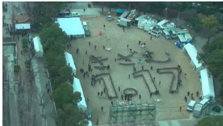
神戸市役所展望階から見た式典終了後の追悼式会場