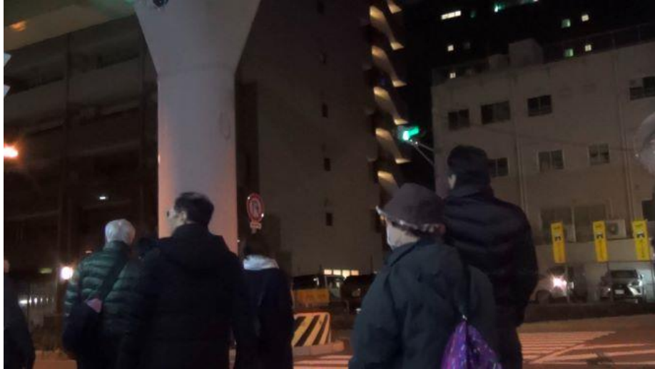
朝5:46の追悼式に向かう