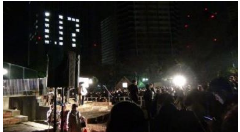
追悼式典、ビルの窓の明かりで 1.17