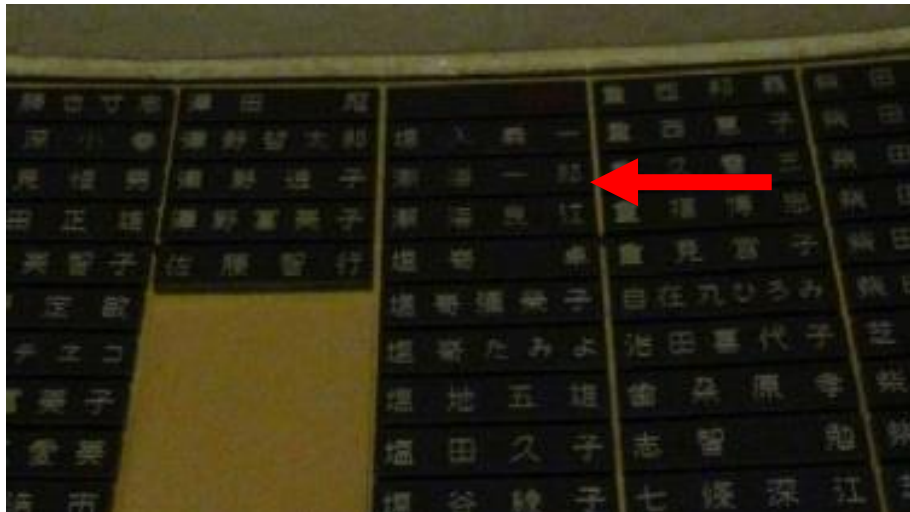
東灘区で亡くなった、叔父・叔母 今年もおとずれ合掌