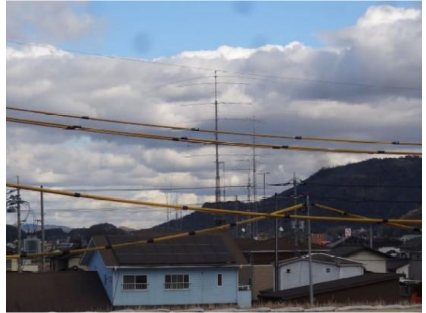
アマチュア無線アンテナファーム発見 7本のアンテナタワーが林立