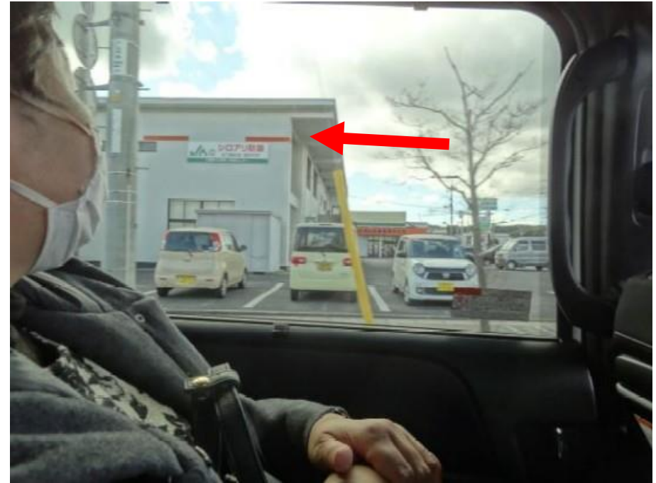
吉備真備駅、街中 矢印の高さ迄水没