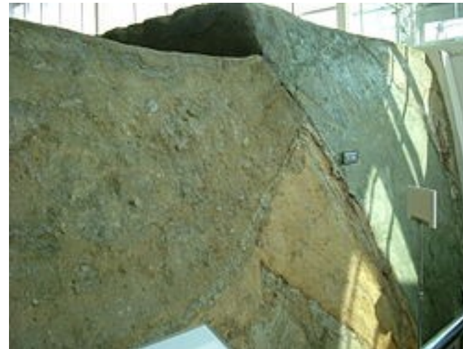
断層・地面のずれ