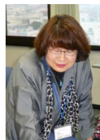
蕪理・女性委員長

懇親会では： ☆ゲーム以上の体験が楽しかった。 ☆たくさんの気づきがあった。 ☆クロスロードも体験してみたい