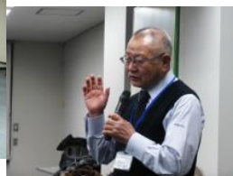
閉会あいさつ（及川・副会長）