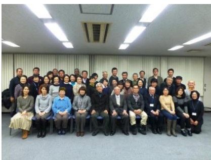
終了後の集合写真