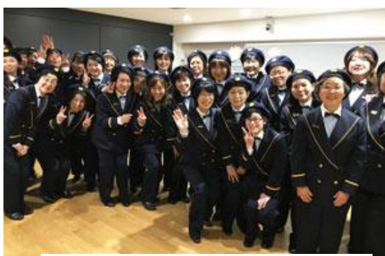
南女性消防団員⇒南公会堂にて