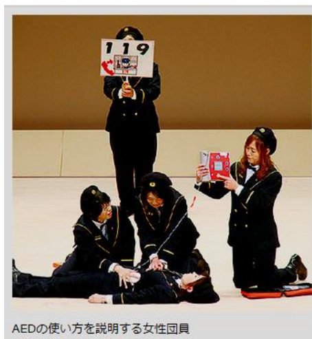
AEDの使い方を説明する女性団員

突然倒れる あなたを見かけた 周りにはだれもいない すぐに肩をたたきながら 呼んでも反応ない 大声叫んで助けを求めて 119番Call AEDも忘れずに持ってきてほしい 息が止まる瞬間の あごの動き見逃すな それは心肺停止で 脳が危ないサインさ 胸の真ん中 両手を置いて 肘を伸ばして 押し始めろ (1・2・3・4)